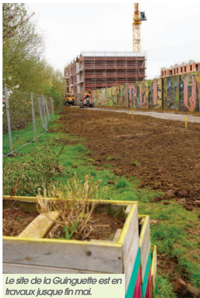
Le site de la Guinguette est en travaux jusque fin mai.