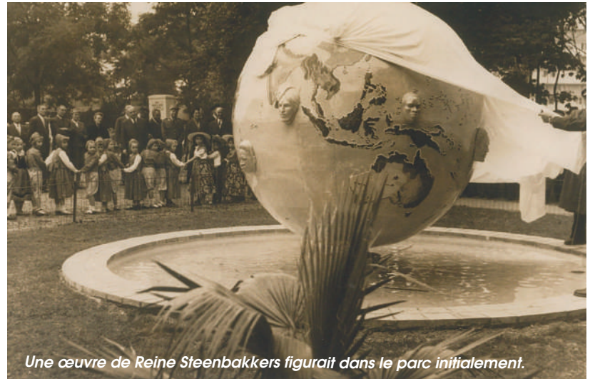
Une œuvre de Reine Steenbakkers figurait dans le parc initialement.

En 1994, dans le prolongement de travaux d'aménagement du centre-ville, le Conseil Municipal décida de mener des travaux d'embellissement et de transformation du parc. Ces